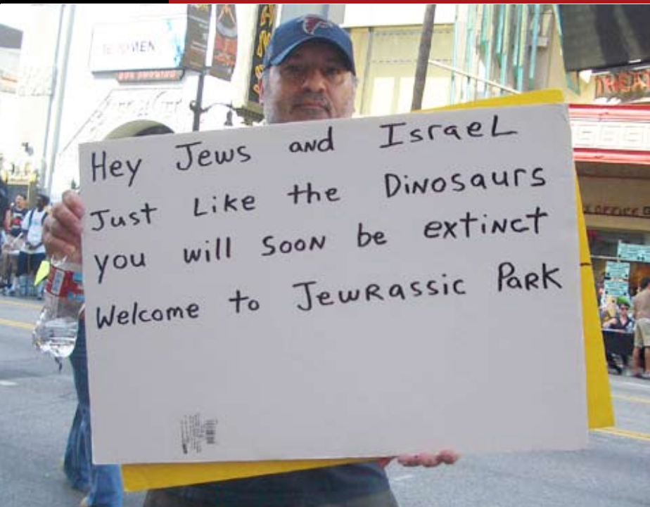
Anti-Israel rally - Los Angeles

La única esperanza de paz es un único estado binacional, eliminando el Estado judío de Israel.