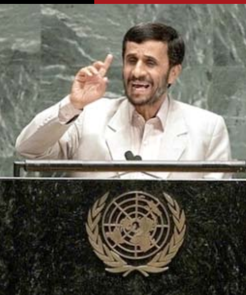
Ahmadinejad at UN

La mayor amenaza para la paz y la estabilidad no es Irán sino un Israel nuclear.